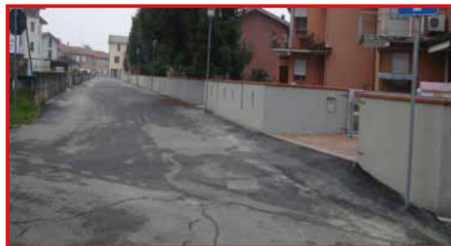
Sistemazione e asfaltatura via A.Mori - Importo dei lavori € 16.000,00