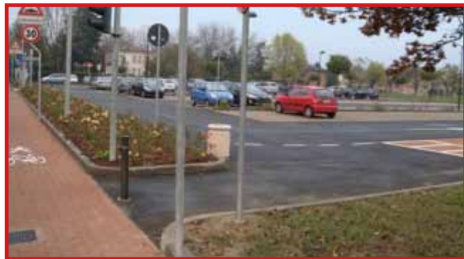
Realizzazione del Parcheggio Unità d'Italia - Importo dei lavori € 500.000,00

Alcune delle piccole e grandi opere realizzate dall'Amministrazione Comunale nel 2011