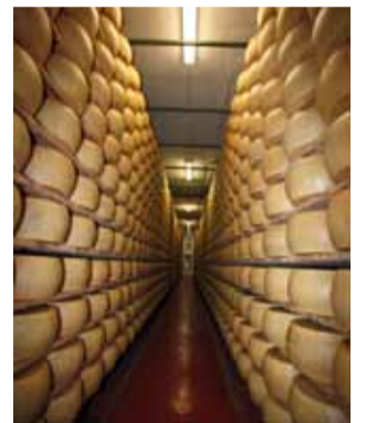
Nelle foto: alcune immagini della festa per i 70 anni della Latteria

per fare in modo che entri no latte nuovo, e, quindi, nuovi soci nella cooperativa. Questo permetterà di avere guadagni maggiori, da reinvestire con i soci per l'ammodernamento delle aziende agricole".