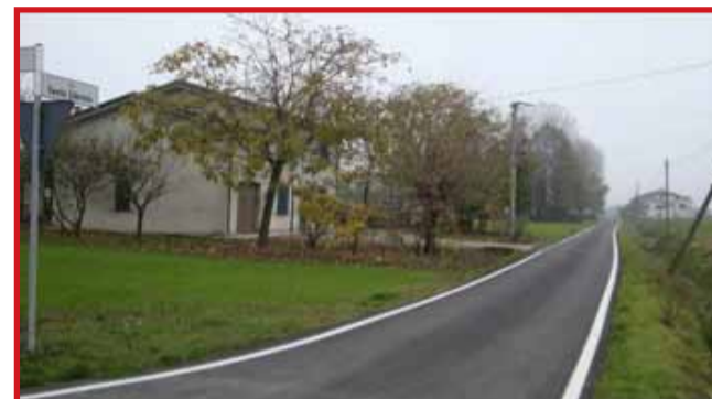
Asfaltatura via Santa Liberata - Importo dei lavori € 34.000,00