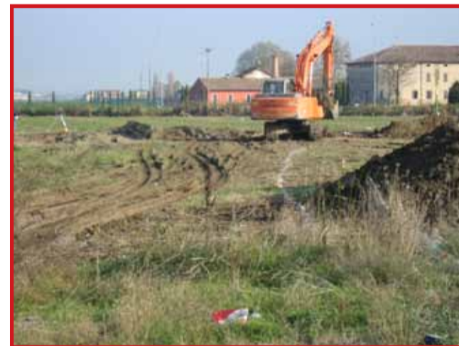
Inizio realizzazione della rotatoria di Sant'Anna - Importo dei lavori € 850.000,00