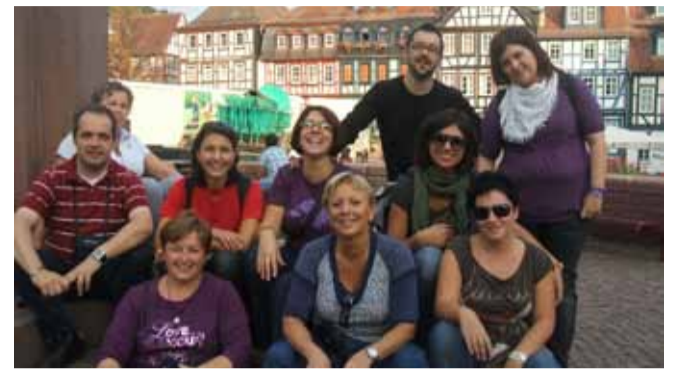
Il Sindaco Manghi e una delegazione della Bassa reggiana in visita a Maintal

anni, basato sullo svolgimento di lezioni all'aria aperta, con l'interazione diretta anche con persone esterne alla scuola. Gli scambi rientrano in un programma più ampio previsto dall'Azienda Speciale Servizi per l'infanzia, finalizzato al confronto tra modelli educativi differenti. Un'attività fondamentale, come ha ribadito nelle due occasioni citate il Sindaco Manghi, che mostra "la volontà del Comune di Poviglio e dei Comuni della Bassa Reggiana di aprirsi all'area vasta degli