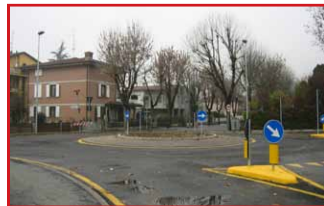
Realizzazione rotatoria tra via Romana e via Gramsci - Importo dei lavori € 120.000,00