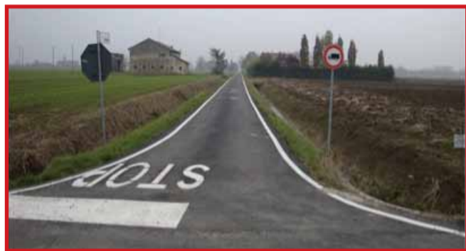
Asfaltatura 2° tratto di via Radice - Importo dei lavori € 39.000,00