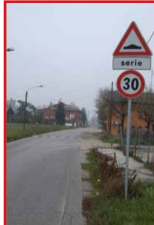
Realizzazione di sovralti nella frazione di Godezza - Importo dei lavori € 4.000,000