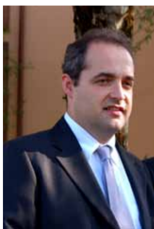
Il Sindaco Giammaria Manghi

L'8 dicembre, tradizionale festività prevista dai calendari civile e religioso, ha rappresentato per la nostra comunità non solo l'occasione per ritrovarsi, nell'ormai classica, quanto partecipata e riuscita, festa di Natale, ma ha segnato, al contempo, l'approdo al traguardo di metà mandato amministrativo: sì, proprio in questa data, abbiamo compiuto 30 dei 60 mesi della legislatura 2009/2014. Un compleanno significativo, che meriterà in altre sedi i dovuti approfondimenti. Ritengo, tuttavia, doveroso, richiamare in questa occasione le più rilevanti scelte di fondo compiute dall'Amministrazione Comunale in questo tempo. A partire dall'attuazione dei meccanismi partecipativi, che ha trovato compimento mediante il varo delle Consulte di frazione ed un ricorso frequente alla promozione di pubbliche assemblee (ben 11 ad oggi) in tutto il territorio. Per proseguire con la realizzazione progressiva, dal punto di vista amministrativo, dell'Unione dei Comuni, alla quale, in un'ottica di ricerca di politiche di area vasta, nonché di razionalizzazione dei costi, sono stati trasferiti già diversi servizi. In materia di pianificazione del territorio,