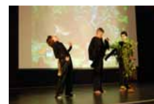
Nelle foto: momenti dello spettacolo e della cena organizzati per i Plédranais