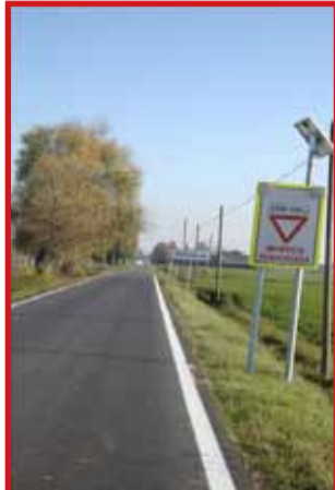
Messa in sicurezza Incrocio tra via Fontanese e via Zappellazzo - Importo dei lavori € 47.500,00