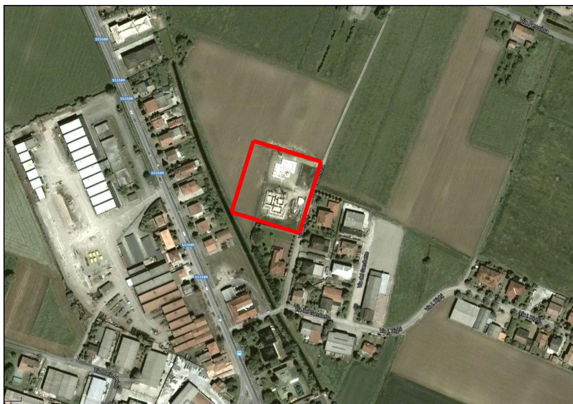
Variante a3 di PSC-RUE: località Poviglio Capoluogo – Via Umbria