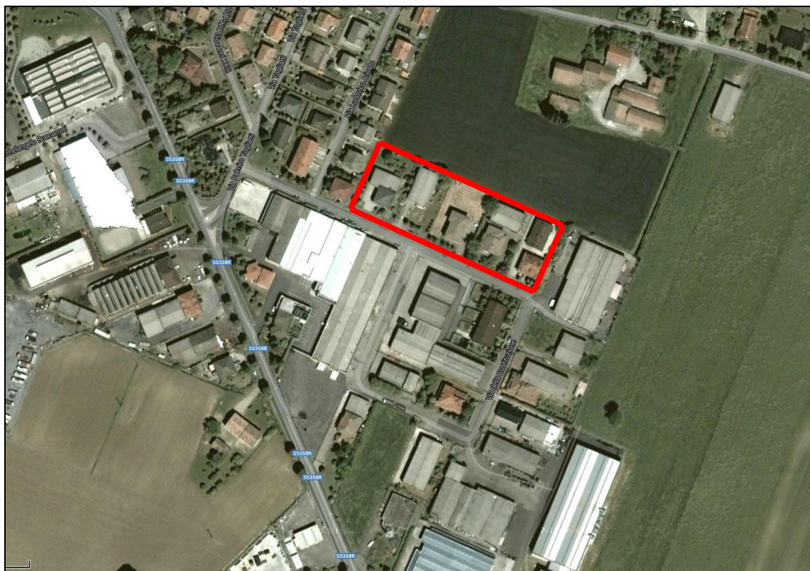
Variante a1 di PSC-RUE: località Poviglio Capoluogo – Via della Costituzione.